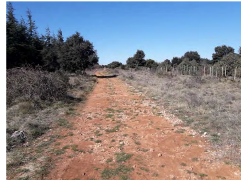
Limite nord de l'emprise projet, où les milieux ouverts doivent être mis en défens