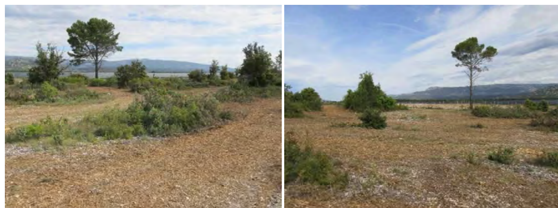
Exemples de débroussaillage / gyrobroyage de type alvéolaire

J. VOLANT, 10/05/2017, Le Castellet (13)