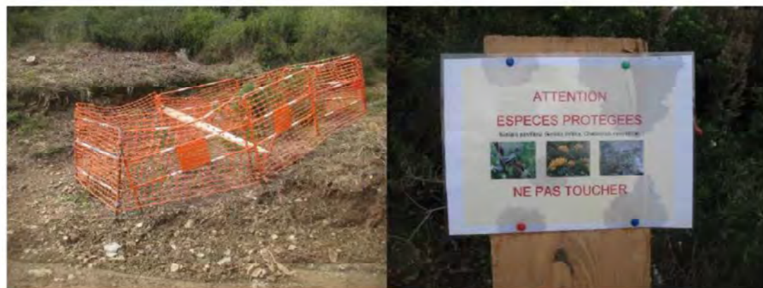
Exemple de mise en défens et d'un panneau informatif

N.B. : l'état du balisage et le respect de ces mises en défens seront contrôlés au cours de l'encadrement écologique en phase de construction avec rédaction d'un compte-rendu. En cas de non-respect des contraintes écologiques à prendre en compte, une note technique sera rédigée, faisant le constat du défaut de conformité et des mesures correctives seront proposées lorsque cela sera possible. A l'issue du chantier, un compte rendu final sera rédigé faisant le bilan de l'audit réalisé durant toute la phase des travaux et sera transmis au pétitionnaire. Cette mesure fait également référence à la mesure de suivis des mesures (Audit d'accompagnement de chantier) au chapitre 9.