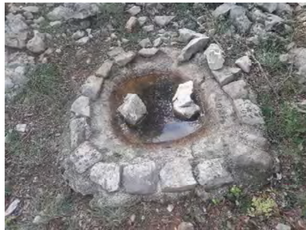
Lavogne à conserver au nord de la zone d'emprise