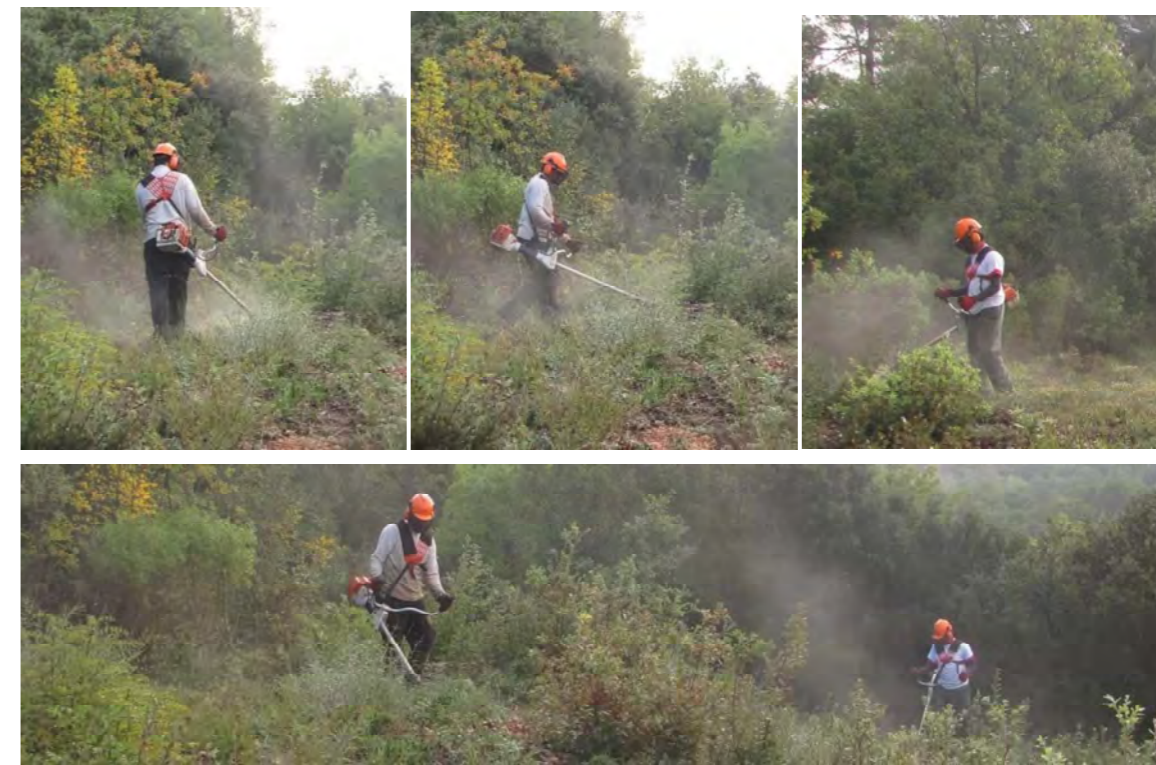
Exemple de débroussaillage manuel

Le type de matériel qui peut être utilisé est par exemple une débroussailleuse à fil, voire à disque si la végétation est constituée d'arbustes ou encore une motofaucheuse munie d'une barre de coupe à lame oscillante. Ce matériel étant portatif, il permet d'orienter plus facilement les coupes et d'éviter plus précisément de petites surfaces.