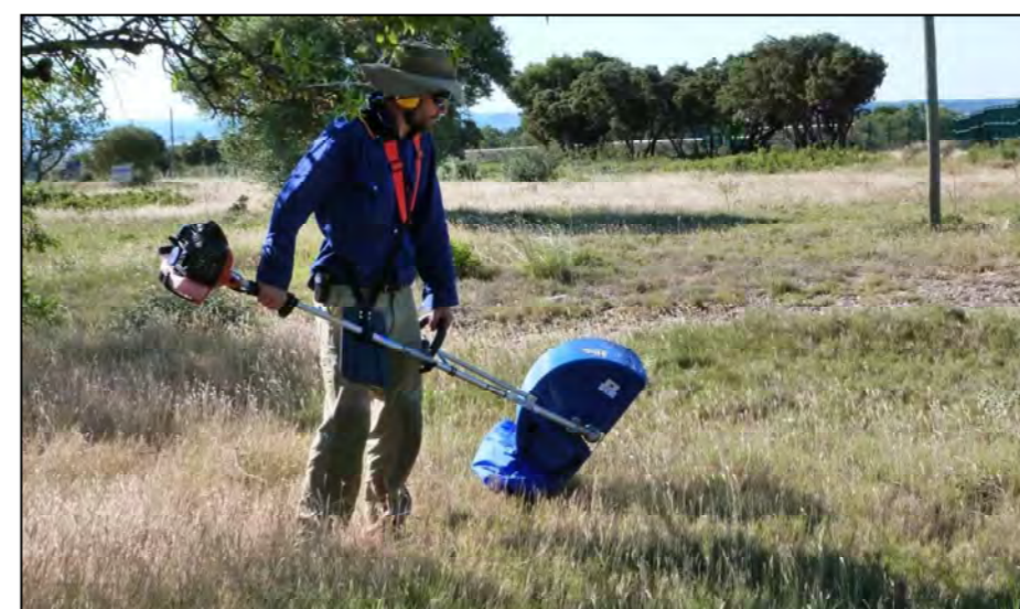
Utilisation de la moissonneuse portative pour récolter les semences d'une pelouse sèche dans les Corbières (11)

Le choix de la méthode de récolte dépend notamment de la végétation, des caractéristiques du site donneur, et du rapport coût/efficacité des différentes techniques de récolte. Compte tenu de la topographie locale du site de récolte envisagé et afin de minimiser l'impact sur les milieux naturels, nous recommandons une récolte à partir d'une moissonneuse portative.