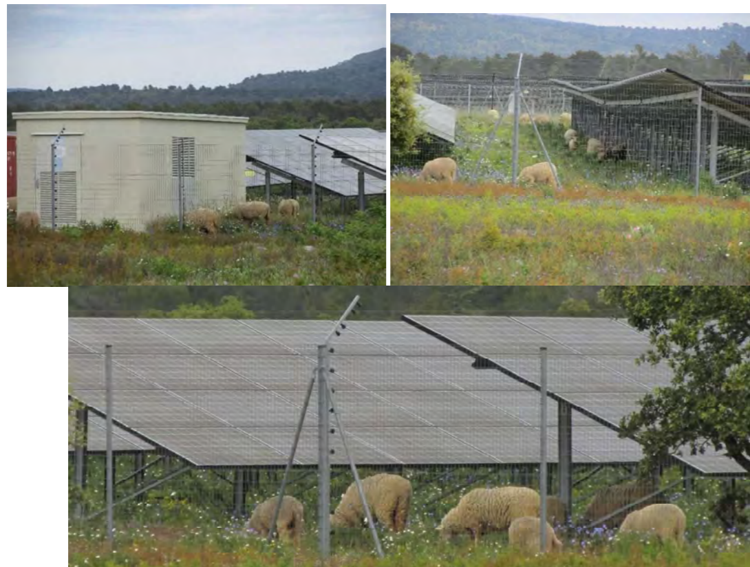
Exemple de pâturage ovin actuellement mis en place au cœur d'un parc photovoltaïque

Par ailleurs, il est également possible d'envisager l'utilisation des caprins, leur régime alimentaire leur permettant d'agir sur les rejets ligneux ainsi que sur les broussailles. Toutefois, en raison des dégâts potentiels sur les modules photovoltaïques que pourraient causer ces animaux ainsi que du nombre peu important d'arbustes présents dans l'enceinte du parc photovoltaïque, l'utilisation de ce type d'animaux n'est pas recommandée.