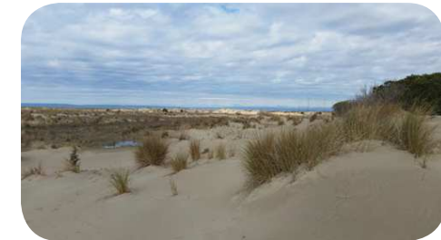
3. Dunes blanches de première ligne