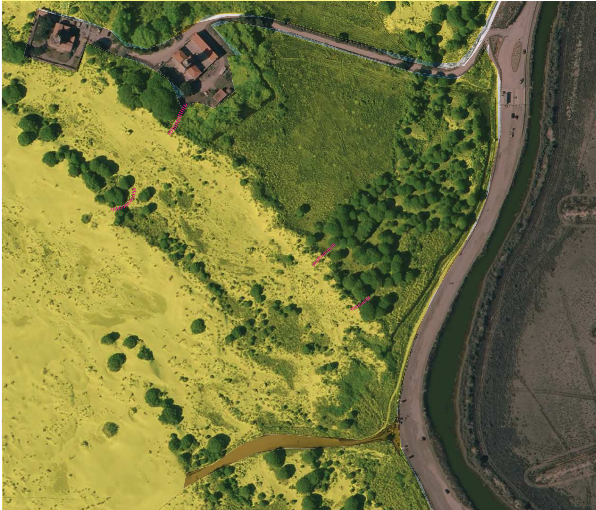
Cartographie définissant les espaces anthropisés et préservés, ainsi que les percées sur les grandes dunes