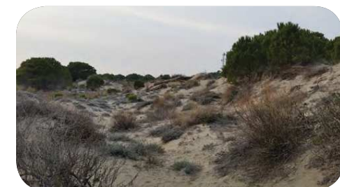
4. Dunes grises et steppe salée