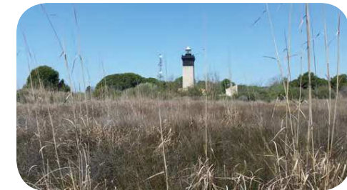
2. La jonchaie