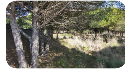
1. La Pinède

Ces circulations sont de vrais fléaux pour la conservation des combes dunaires (quasiment stabilisés par la présence des deux grandes dunes). Les milieux humides tels que les fossés et la jonchaie, forment des limites naturelles infranchissables canalisant les circulations. Les ganivelles forment des barrières parfois vandalisées pour permettre le passage.